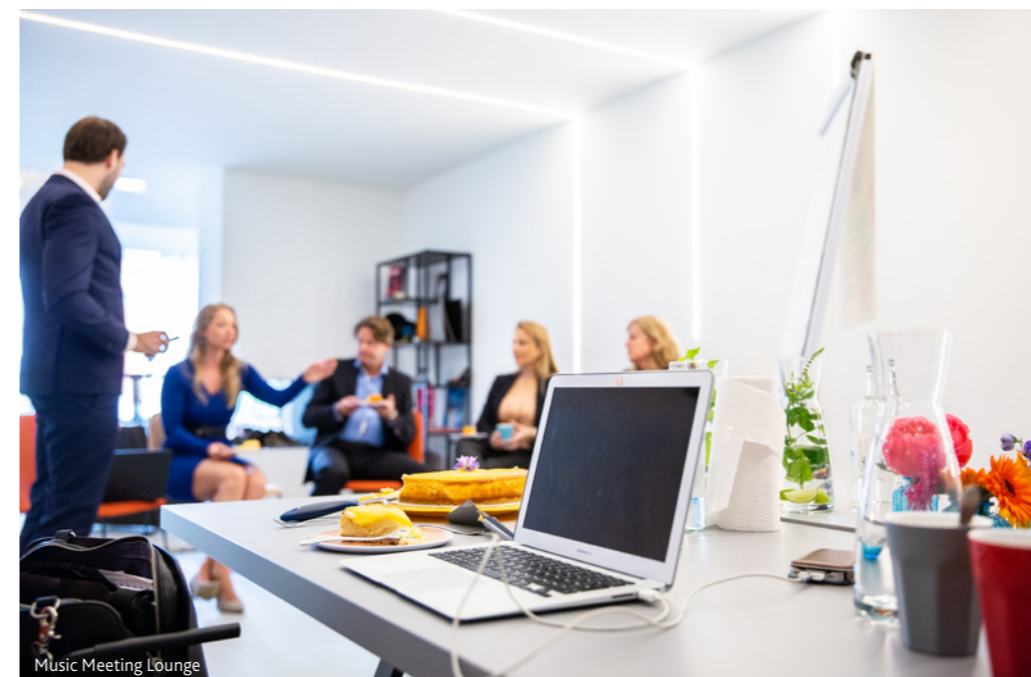
Music Meeting Lounge